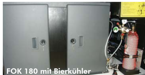
FOK 180 mit Bierkühler